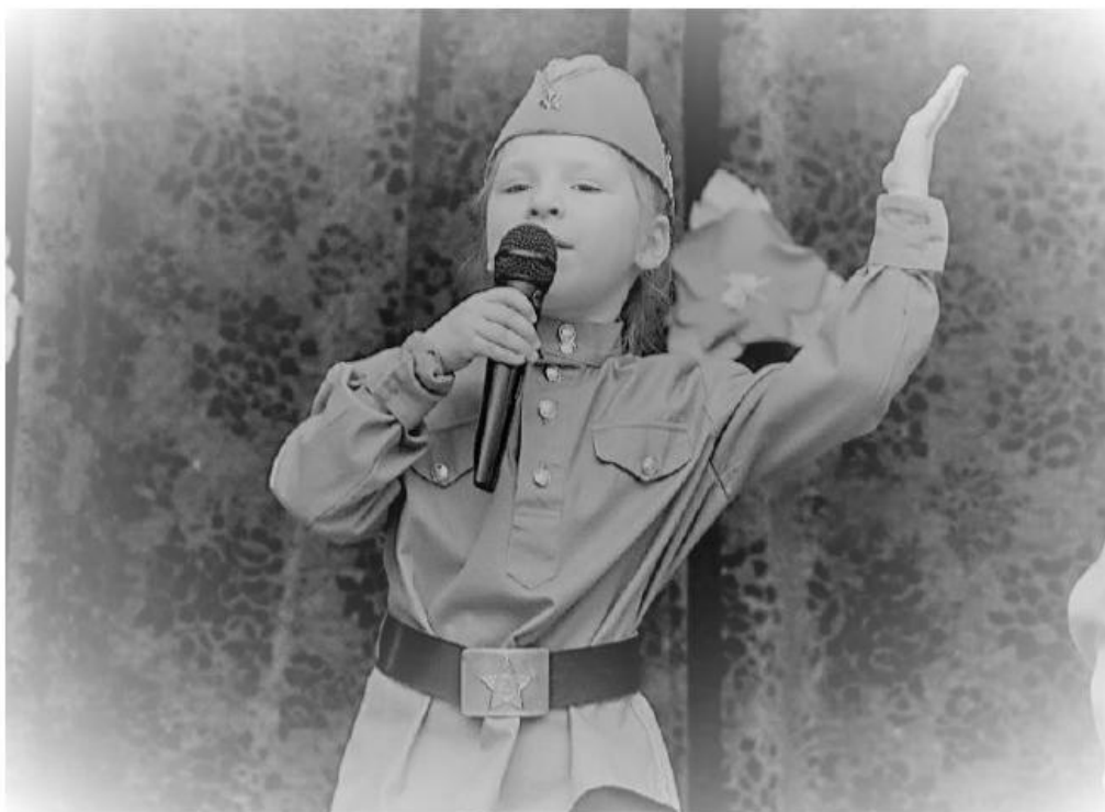
Рис 2. Старт Акции на базе дошкольного отделения ГБОУ «Школа № 1359 имени авиаконструктора М.Л. Миля» (Москва)