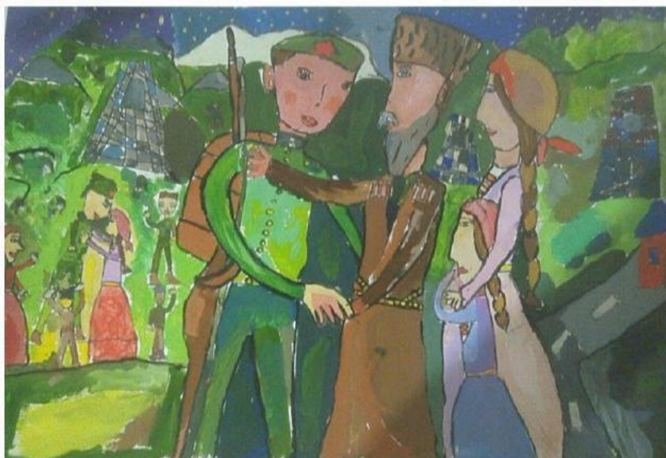
Цокова Кира, 6 лет «Возвращение домой» Республиканский Лицей Искусств (г.Владикавказ)