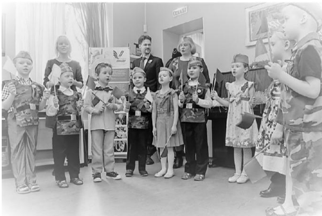
Рис 3. Подведение итогов Акции на базе дошкольного отделения ГБОУ «Школа № 2101» (Москва)