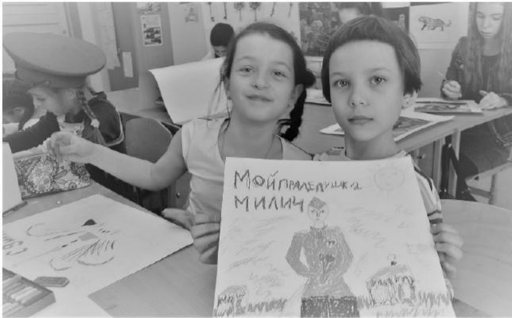
Рис 4. Учащиеся ГБОУ «Гимназия № 92 Выборгского района» принимают участие в Акции (Санкт-Петербург)