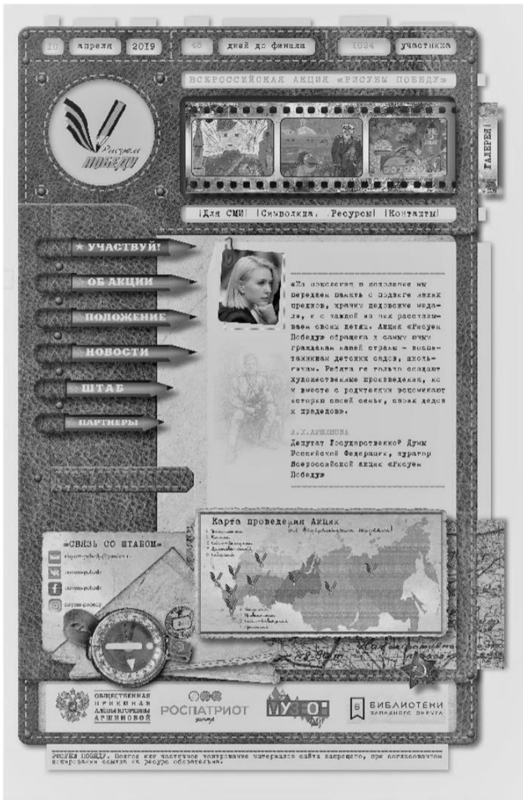
Рис 1. Внешний вид сайта Всероссийской акции «Рисуем Победу»