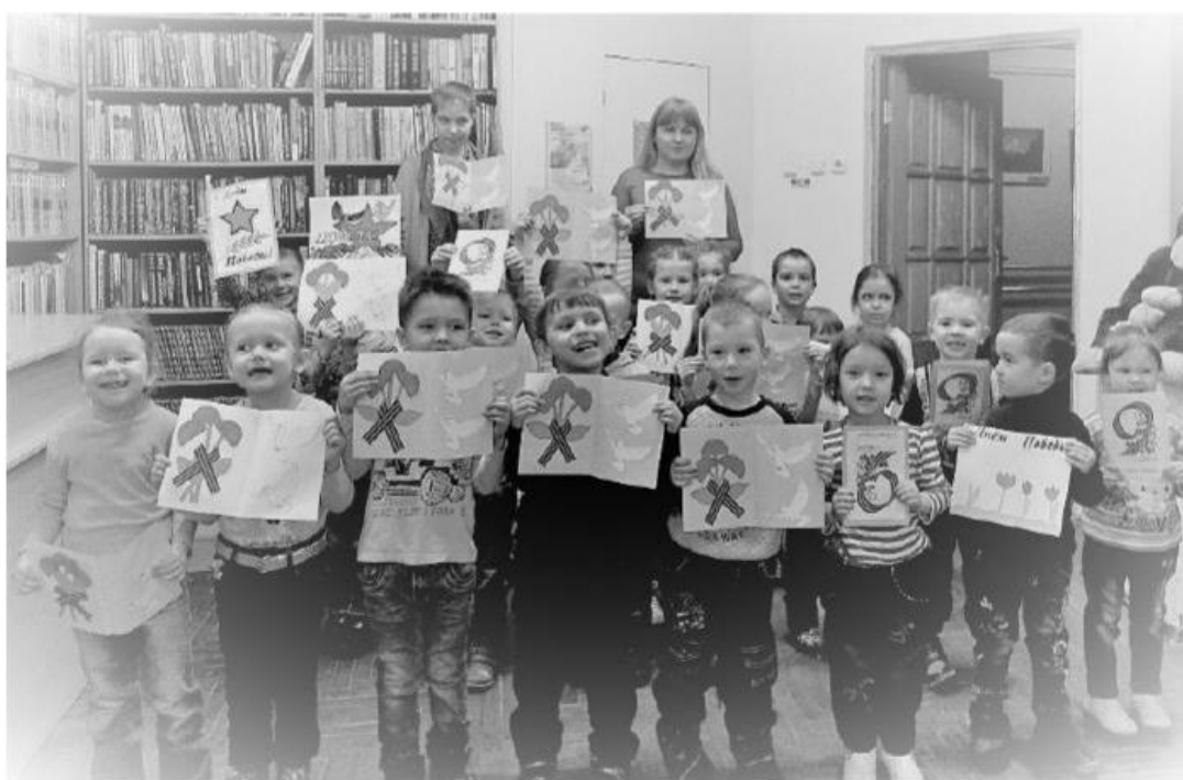
Рис 7. Читатели Центральной городской библиотеки имени В.В. Маяковского с созданными в рамках Акции творческими работами (Чувашская Республика, г. Чебоксары)