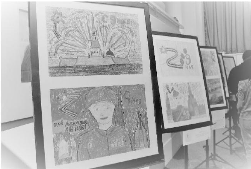
Рис 5. Выставка лучших работ учащихся школ Выборгского района Санкт-Петербурга – участников Акции (Санкт-Петербург)