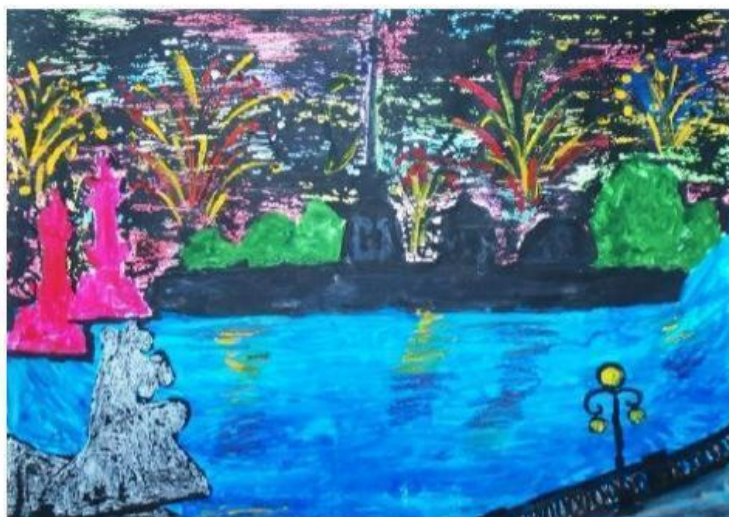
Никольская Валерия, 6 лет «Салют Победы в Ленинграде» Детский сад № 39 Центрального района (Санкт-Петербург)

Младшая возрастная категория (4 - 6 лет)