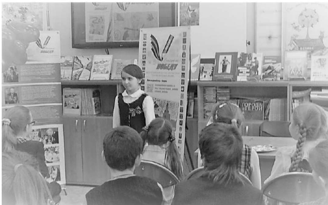
Рис 6. Проведение Акции в Библиоцентре детского чтения Выборгского района Санкт-Петербурга (Санкт-Петербург)